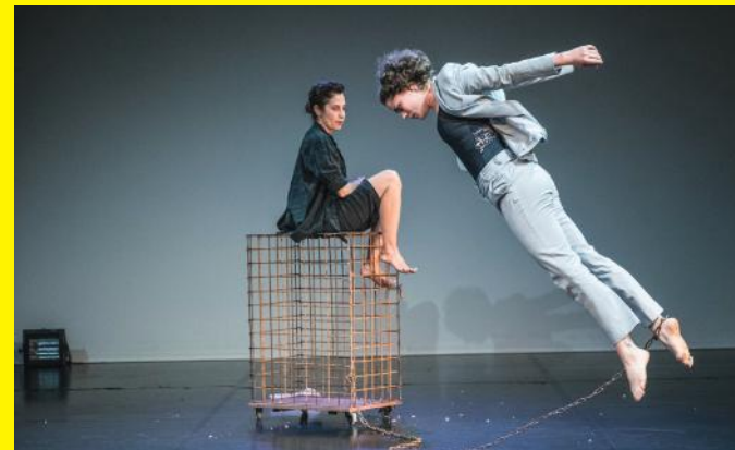
Fox Keeper

Nach den Vorstellungen begleitet ein Moderator den Gedankenaustausch zwischen dem Publikum, den Wissenschaftlerinnen und den Künstlerinnen und Künstlern.